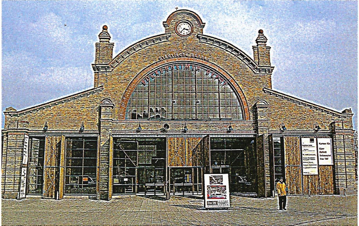
BOCKENHEIMER DEPOT FRANKFURT AM MAIN